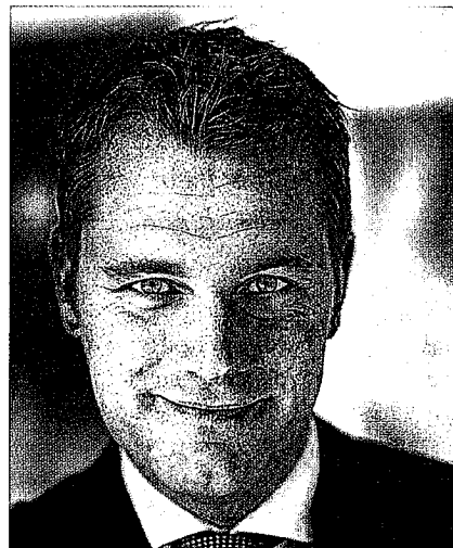
Daniel Bahr (FDP): »Pick-up-Stellen sind eine Verzerrung des Wettbewerbs.« Quelle: FDP

Die erste Lesung des AMNOG-Kabinettsentwurfs findet am 9. Juli statt. /